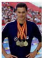
+ Александр Попов