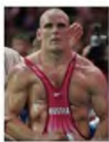
- Александр Карелин