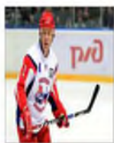
- Вячеслав Фетисов