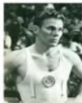
- Юрий Титов