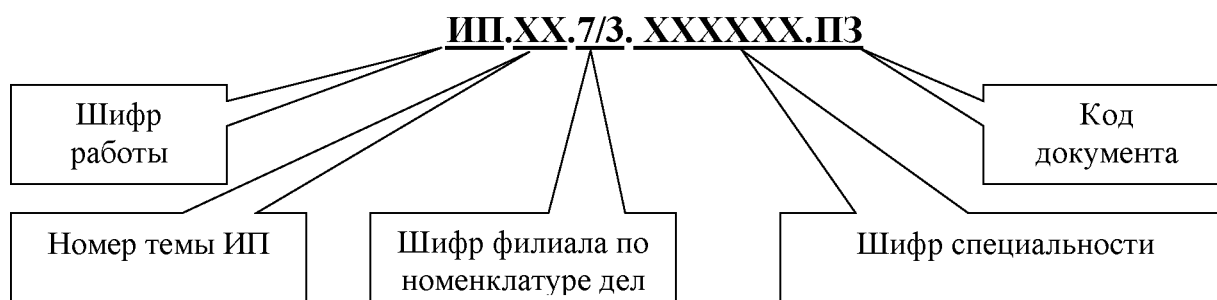
Рисунок 1 – Полная структура обозначения документа

Полная структура обозначения документа приведена на рисунке 1.