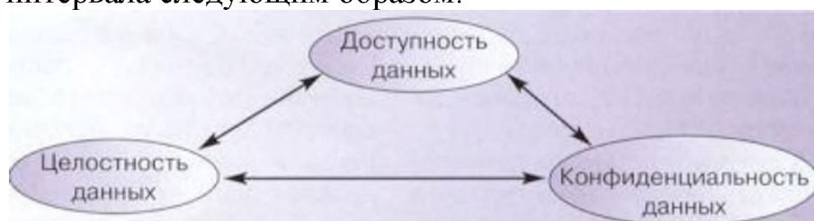
Рисунок 1 – Основные цели сетевой безопасности

Все иллюстрации должны иметь наименование. Иллюстрации могут иметь пояснительные данные (подрисуночный текст). Слово «Рисунок» и его наименование помещают после пояснительных данных и располагают под рисунком без интервала следующим образом: