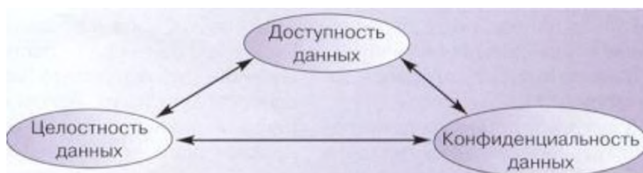
Рисунок 1 – Основные цели сетевой безопасности

Все иллюстрации должны иметь наименование. Иллюстрации могут иметь пояснительные данные (подрисуночный текст). Слово «Рисунок» и его наименование помещают после пояснительных данных и располагают под рисунком без интервала следующим образом: